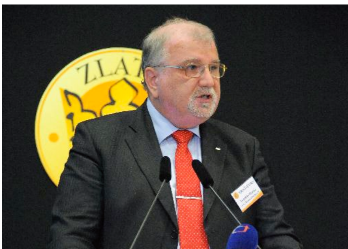
Jaroslav Hanák, prezident Svazu průmyslu a dopravy ČR a prezident Svazu dopravy ČR

Mezi hlavními řečníky X. Fóra Zlaté koruny na téma „Korupce jako ekonomický fenomén“, které proběhlo 14. června 2011, byl Jaroslav Hanák, prezident Svazu průmyslu a dopravy ČR. V poměrně kritickém vystoupení shrnul některé aspekty korupce a přinesl několik návrhů na její potření. Hlavní pasáže jeho vystoupení nabízíme čtenářům Spektra.