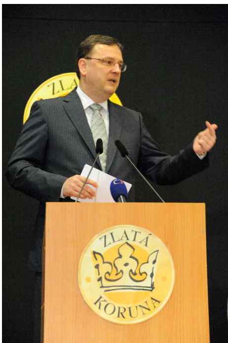
Petr Nečas, předseda vlády ČR

X. Fórum Zlaté koruny, na němž s řadou návrhů na potírání korupce vystoupil i prezident Svazu průmyslu a dopravy ČR, přineslo řadu nápadů, dělnou atmosféru i zklamání z vystoupení předsedy vlády.