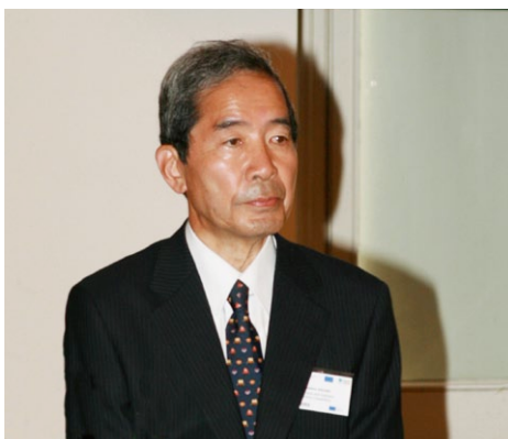
Tadahiro Asami, generální tajemník BIAC

Ve středu 15. června proběhl Podnikatelský kulatý stůl organizovaný Svazem průmyslu a dopravy ČR v rámci třídní konference OECD zaměřené na spolupráci se šesti zeměmi Východní Evropy a Jižního Kavkazu. Konference je součástí iniciativy OECD zaměřené na zvýšení konkurenceschopnosti a vytváření příznivých podmínek pro podnikání v zemích tohoto regionu (Eurasia Competitiveness Programme). Tento program je zaměřen především na posílení mezinárodní spolupráce malých a středních podniků.