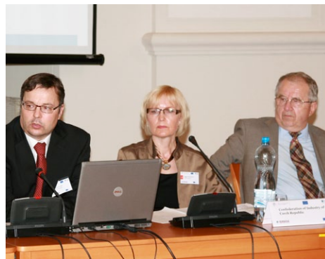
Martin Tlapa, náměstek ministra průmyslu a obchodu, Dagmar Kuchtová, zástupkyně generálního ředitele SP ČR, Stanislav Kázecký, viceprezident SP ČR

Třetí den konference 17. 6. zahájil místopředseda vlády ČR a ministr