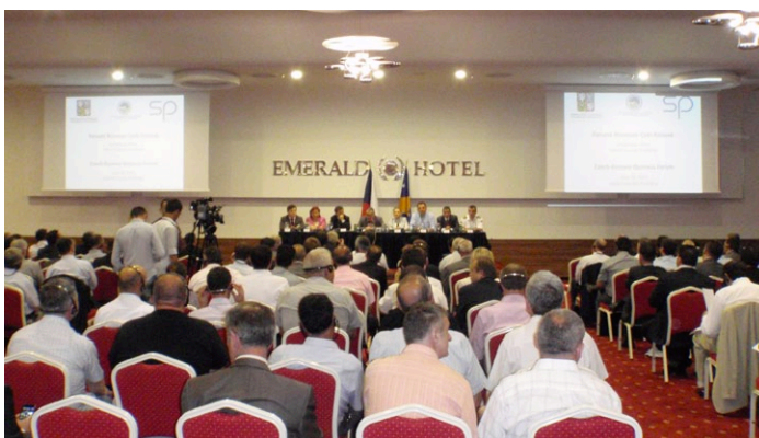
Zcela zaplněný sál hotelu Emerald během úvodních projevů při zahájení Business fora

Zájem o tuto podnikatelskou misi nás přesvědčil, že kosovský trh je pro řadu českých firem přitažlivý, a že zde svou činnost mohou rozvíjet zvláště společnosti aktivní v jiných zemích západního Balkánu, ale i jiné subjekty s vhodným podnikatelským záměrem. V Kosovu se rýsuje řada projektů ve výše uvedených oborech, ale i dalších oblastech. Důležitou roli bude hrát také spolupráce České exportní banky a EGAP s firmami.