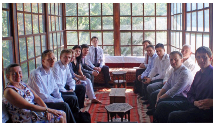
Podnikatelská delegace na návštěvě etnografického muzea v Prištině

Na základě získaných zkušeností bychom rádi na tuto cestu navázali další podnikatelskou delegací, nejlépe spojenou s účastí na příštím strojírenském veletrhu v Prištině, v květnu