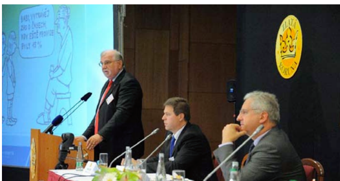
Jaroslav Hanák, prezident Svazu průmyslu a dopravy ČR a prezident Svazu dopravy ČR

prizpůsobil systému a těží z něj parciální a dočasné výhody. V celém systému se točí ohromné mnohamiliardové částky, které jsou firmy nuceny kalkulovat do svých nákladů. Korupce se stala součástí takřka běžné ekonomické kalkulace, která musí počítat s průměrnou výší úplatku z hodnoty veřejné zakázky kolem 16 procent a s nejčastěji poskytovaným úplatkem na úrovni deseti procent.