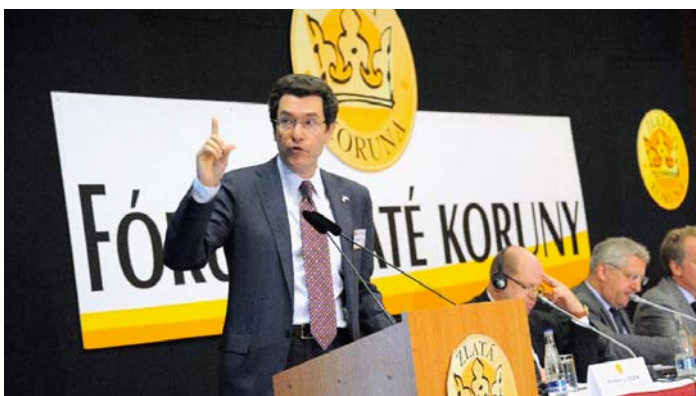
Norman L. Eisen, velvyslanec USA v České republice