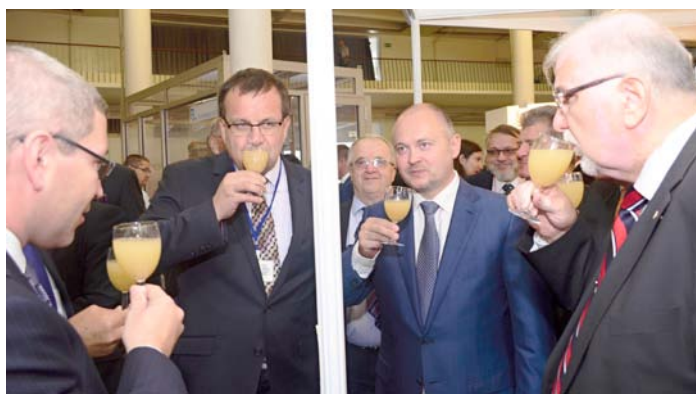
K tradicím prohlídek na MSV Brno pro významné hosty již patří přípitek burčákem z jihomoravských vinic.