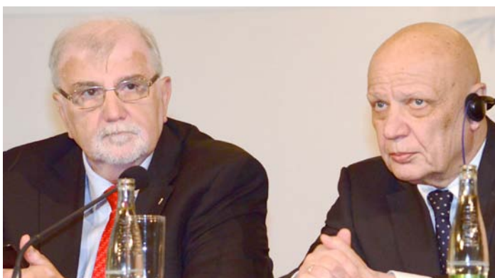
Regionální spolupráce byla jedním z témat Business dne Ruské federace, v Rotundě brněnského Výstaviště, který je již tradičně součástí programu MSV. Aktivnější přístup české vlády a jednotlivých krajů při navazování kontaktů s ruskými regiony doporučil SP ČR.