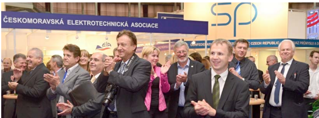
Svaz průmyslu a dopravy ČR, Českomoravská elektrotechnická asociace (ELA) a Zvaz elektrotechnického priemyslu SR uspořádaly v Robotickém parku v pavilonu Z společenský večer „Setkání průmyslu MSV 2014“ s účastníky soutěže Zlatá medaile a dalšími významnými hosty. O hudební produkci se postarala firemní rocková kapela ELKO BAND.