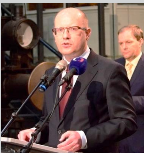
Podporu vlády snahám SP ČR o rozvoj technického vzdělávání vyjádřil i premiér Bohuslav Sobotka.