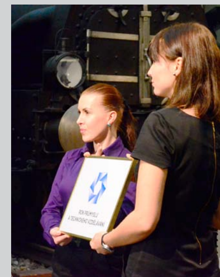
Představení loga Roku průmyslu a technického vzdělávání.