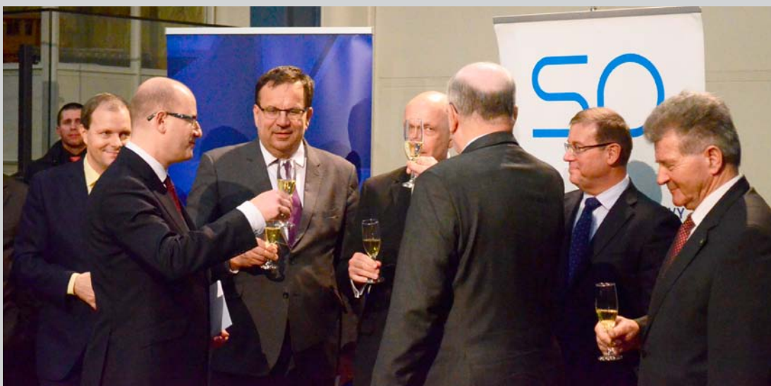
Přípitek účastníků na zdar Roku průmyslu a technického vzdělávání.