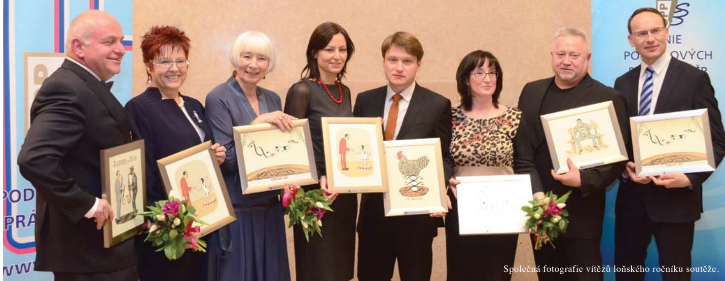
Společná fotografie vítězů loňského ročníku soutěže.