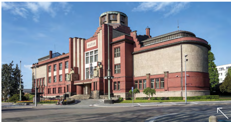
Muzeum východních Čech v Hradci Králové