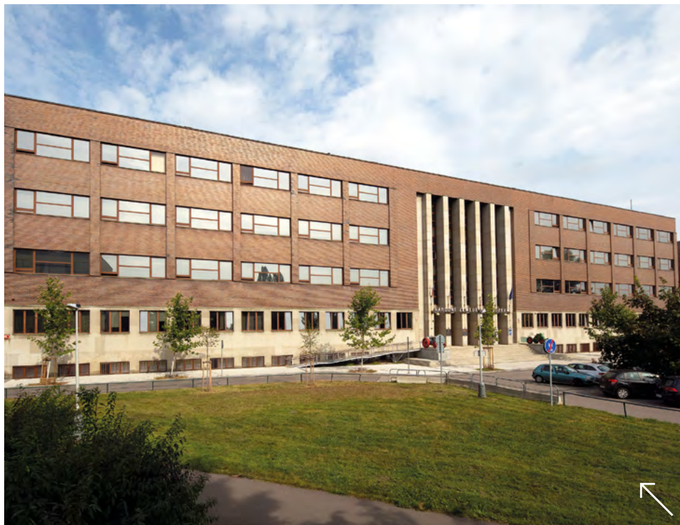
Národní zemědělské muzeum