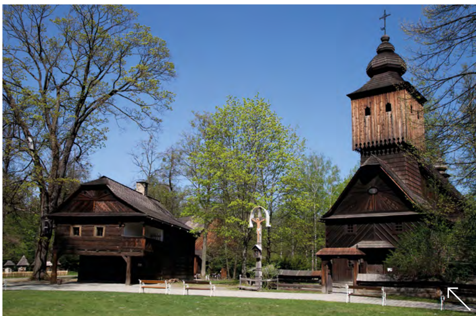
Národní muzeum v přírodě