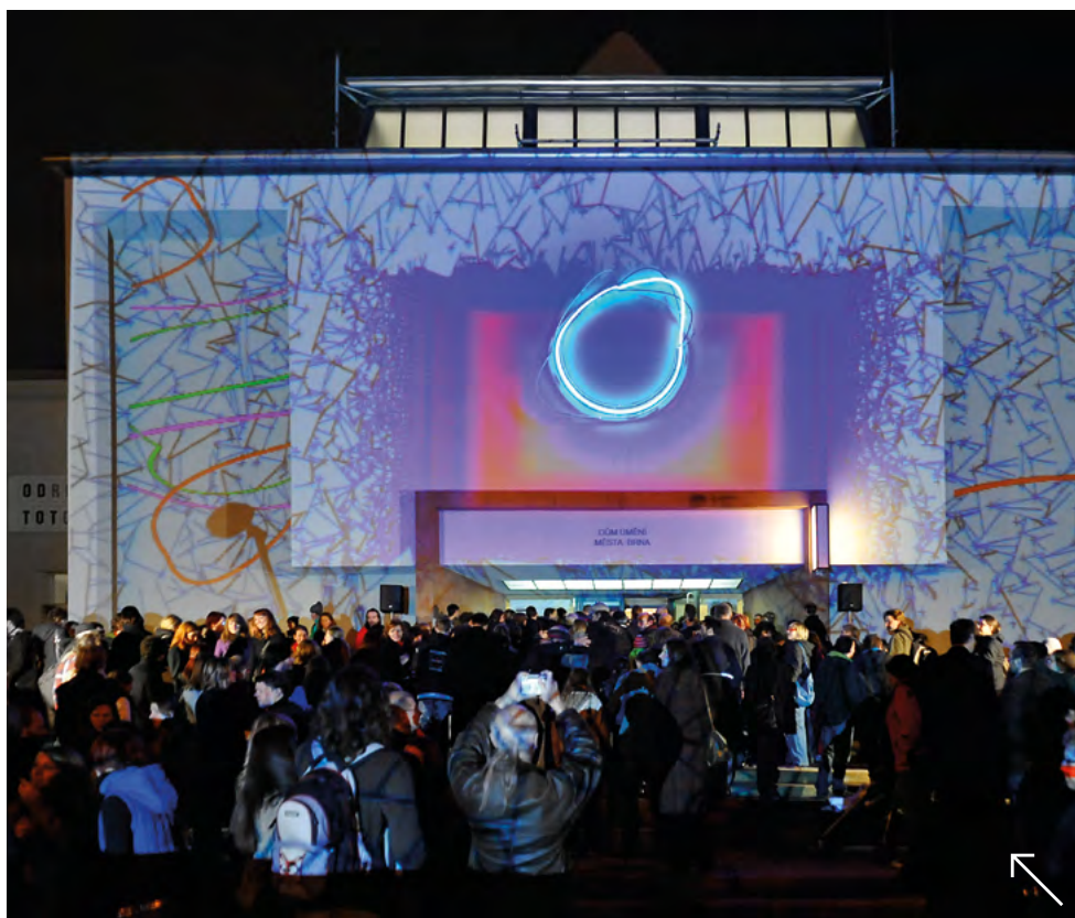
Dům umění města Brna