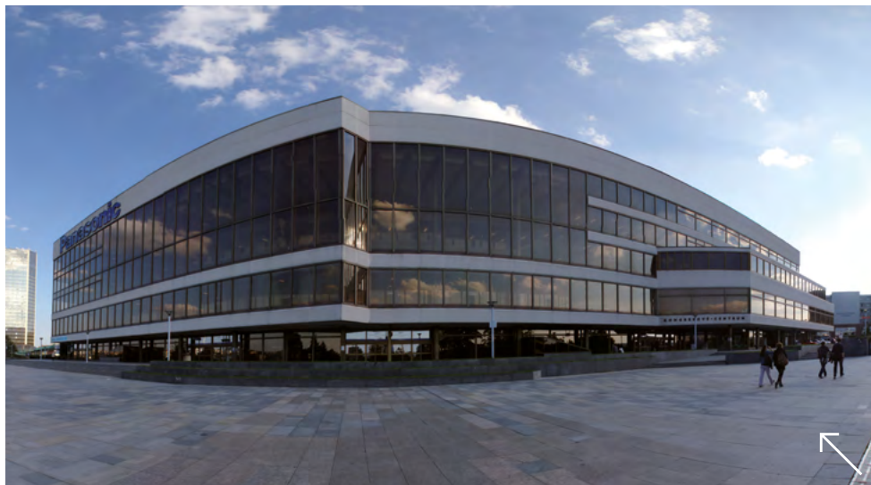
Kongresové centrum Praha

Účastníci konference uhradí registrační poplatek v základní výši 350,- EUR pro fyzickou a 150,- EUR pro online účast.