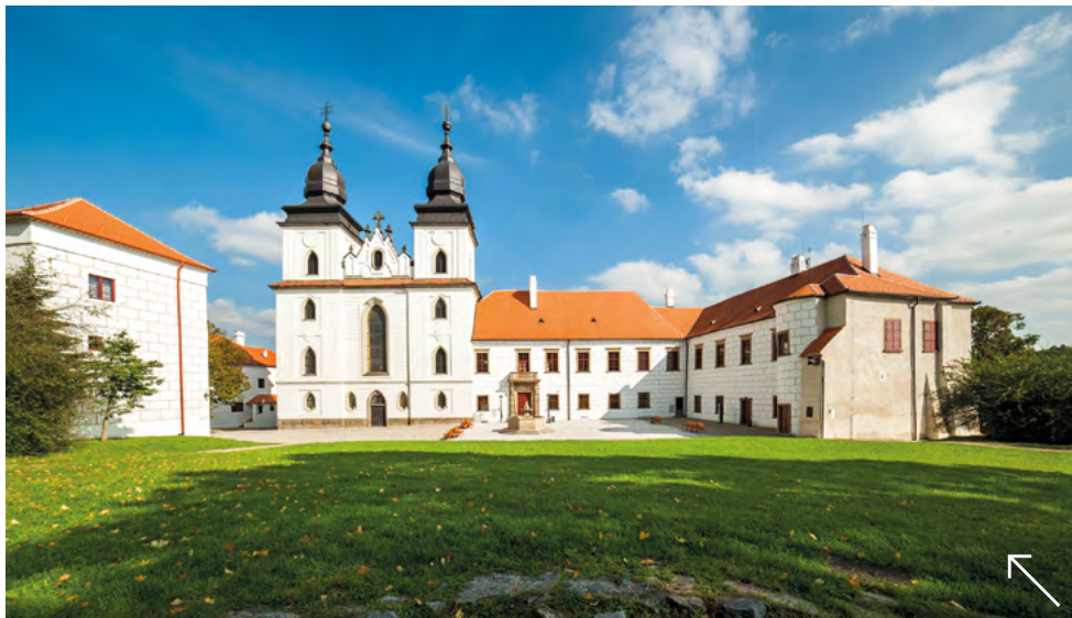
← Muzeum Vysočiny Třebíč