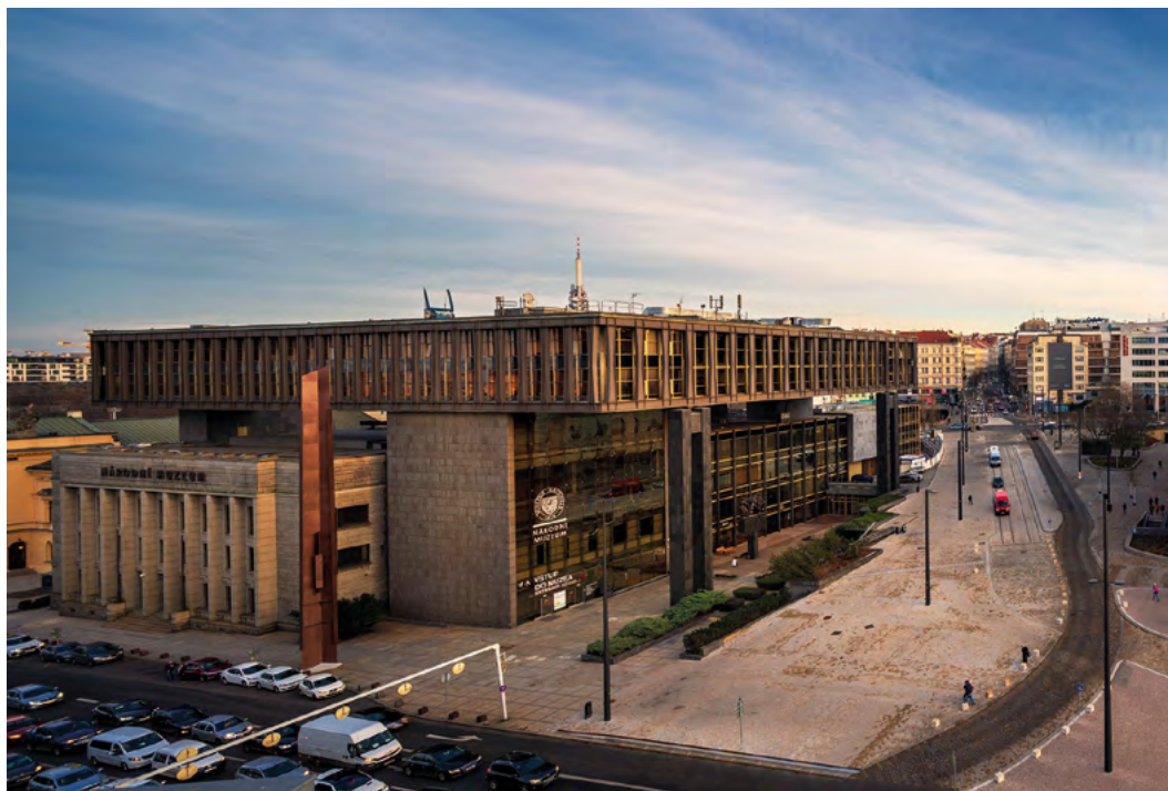
Muzejní komplex Národního muzea