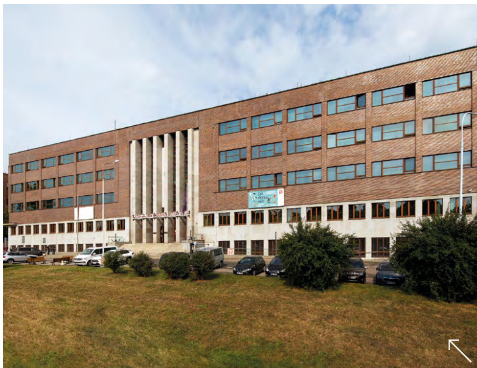
Národní technické muzeum

ICOM international council of museums Česká republika