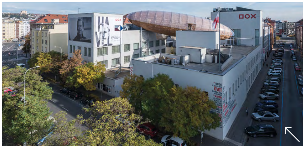
Centrum současného umění DOX